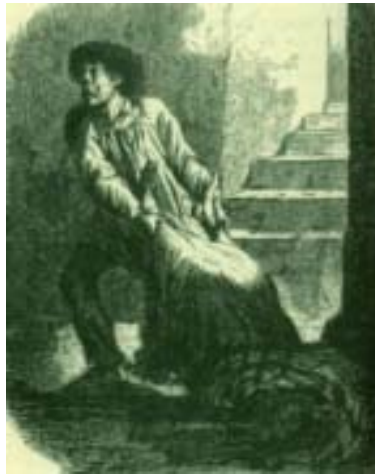
Les Mystères de Paris di Eugène Sue

L'archetipo del genere è Les Mystères de Paris di Eugène Sue (1804 –1857). La prima puntata del romanzo apparve il 19 giugno 1842 in appendice al conservatore Journal des Débats e la pubblicazione proseguì fino al 15 ottobre dell'anno successivo, per un totale di 147 appendici subito riunite in dieci volumi. Il romanzo ottenne un trionfale successo di pubblico e l'eco si fece sentire anche in sede governativa. Durante la pubblicazione, infatti, nonostante il Journal fosse accusato in Parlamento di " far passeggiare da un anno i suoi lettori per le fogne parigine ", Sue ricevette la Croce della Legion d'onore dal Ministro della Pubblica Istruzione.