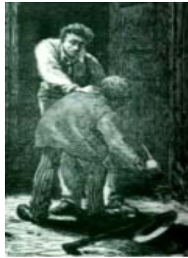
I Misteri di Napoli di Francesco Mastriani

sono un documento importante per la conoscenza dei costumi e della psicologia del popolo e della piccola borghesia, in quel periodo di incertezze e di rinnovamento che sta fra il Risorgimento e l'Unità degli italiani. Sono racconti di morti resuscitati, di morti ammazzati, di morti scampati e moribondi allucinati. Sono intrighi di profittatori, ladri, assassini, usurai, ed altri “mariuoli”, spesso deformi e perversi, in mezzo ai quali si muove una coppia di sposi promessi, Marta ed Onesimo. L'epilogo è tragico per la morte della povera Marta la quale era ignara che il padre “Cecatiello” fosse in realtà un ladro ed un assassino, responsabile della morte del perfido marchese di Massa-Vitelli della quale era stato ingiustamente accusato e per questo tratto in arresto proprio Onesimo.